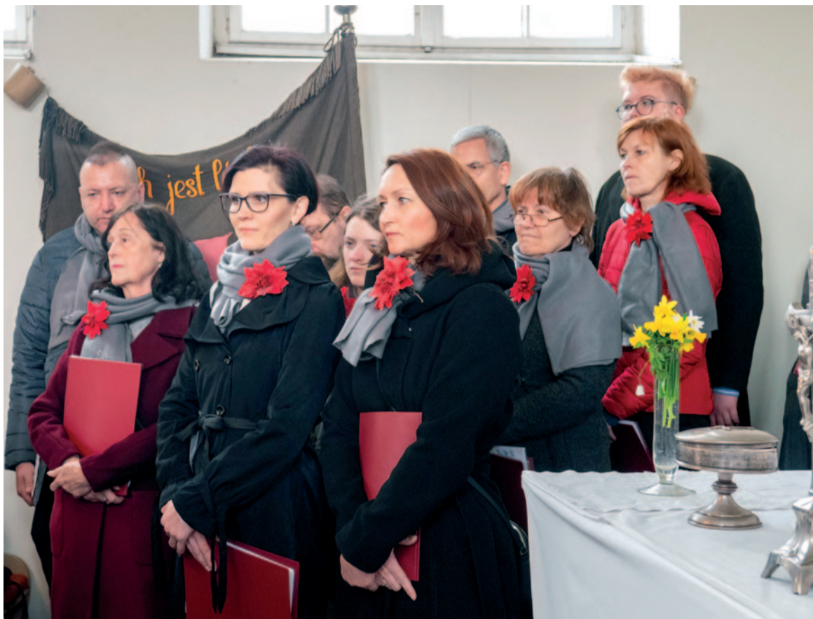
Pěvecký sbor Základní umělecké školy z Hradce nad Moravicí doprovázel setkání zpěvem v kapli i při pietním aktu na zahradě sboru. Další fotografie najdete na webových stránkách církve.