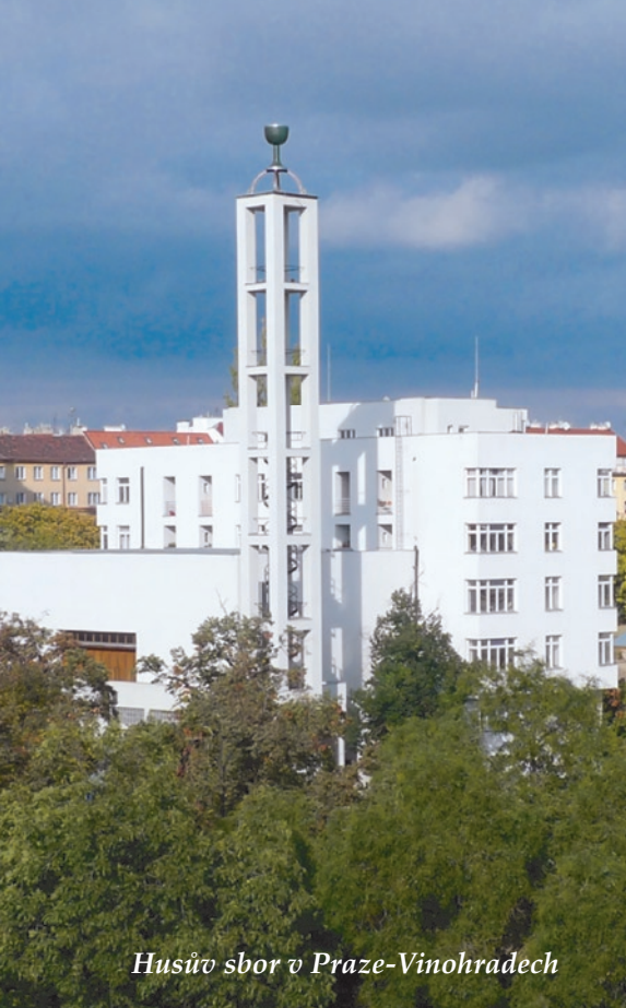
Husův sbor v Praze-Vinohradech