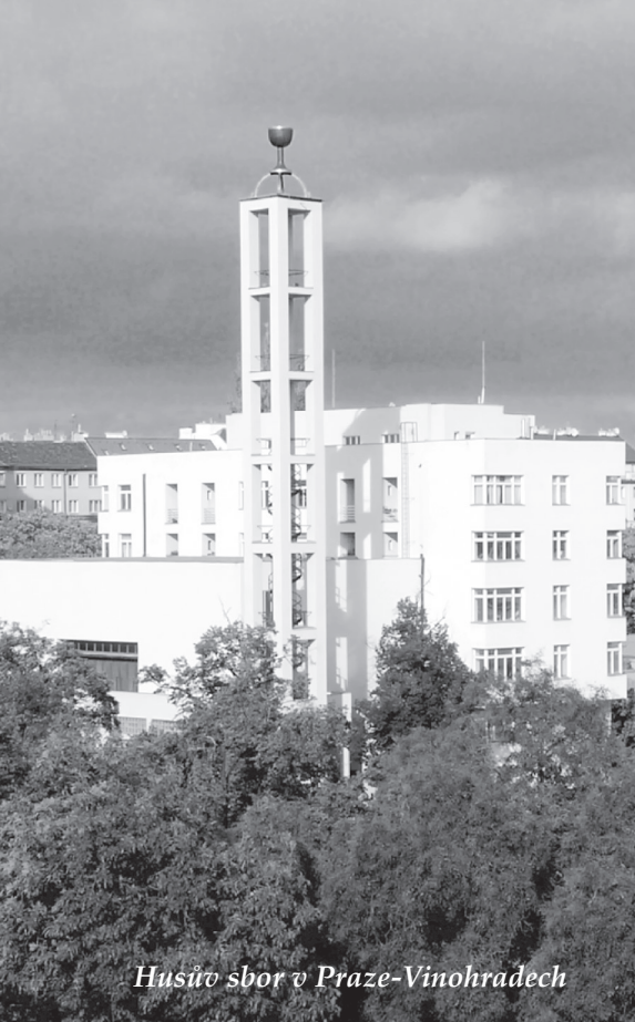
Husovo sbor v Praze-Vinohradech