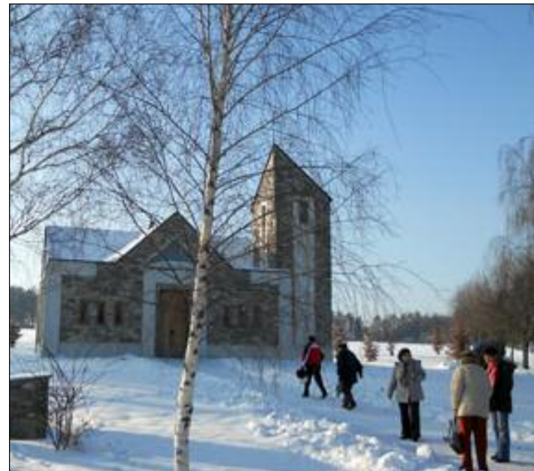
Kaple v Rudici

Etické aspekty genetického inženýrství zůstávají dodnes celospolečensky nerozřešeny. Přitom již dnešní technologie umožňuje aktivně zasahovat do genetické výbavy budoucích dětí, například je technicky (nelegálně) možné jim zvolit pohlaví. Jiným příkladem technologických možností je chov skotu, kde je již obvyklé křížit jedince s cílem optimalizovat vlastnosti potomků (dojivost, plodnost) a tedy hledat partnery na křížení pomocí genetických testů. Tím člověk bere do svých rukou nástroje Boží tvořivosti. Věda však vznikla v křesťanských národech a státech, konkrétně genetiku založil brněnský mnich a Galtonův současník Johann Gregor Mendel (1822-1884), a proto bychom právě my jako křesťané měli usilovat o dodržování etických zásad ve vědě a technologiích, aby se nezneužilo jejich původní poslání. Také tím naplníme svůj úkol být soli země (Mt 5,13).