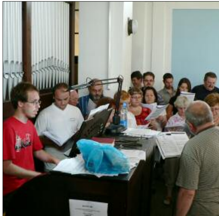
Ze 17. ročníku varhanického kurzu - viz str. 1