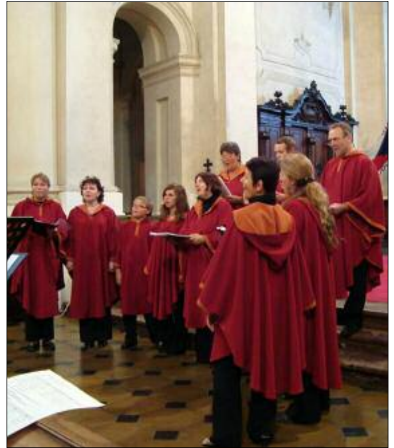
Soubor Malikchór z Chrudimi