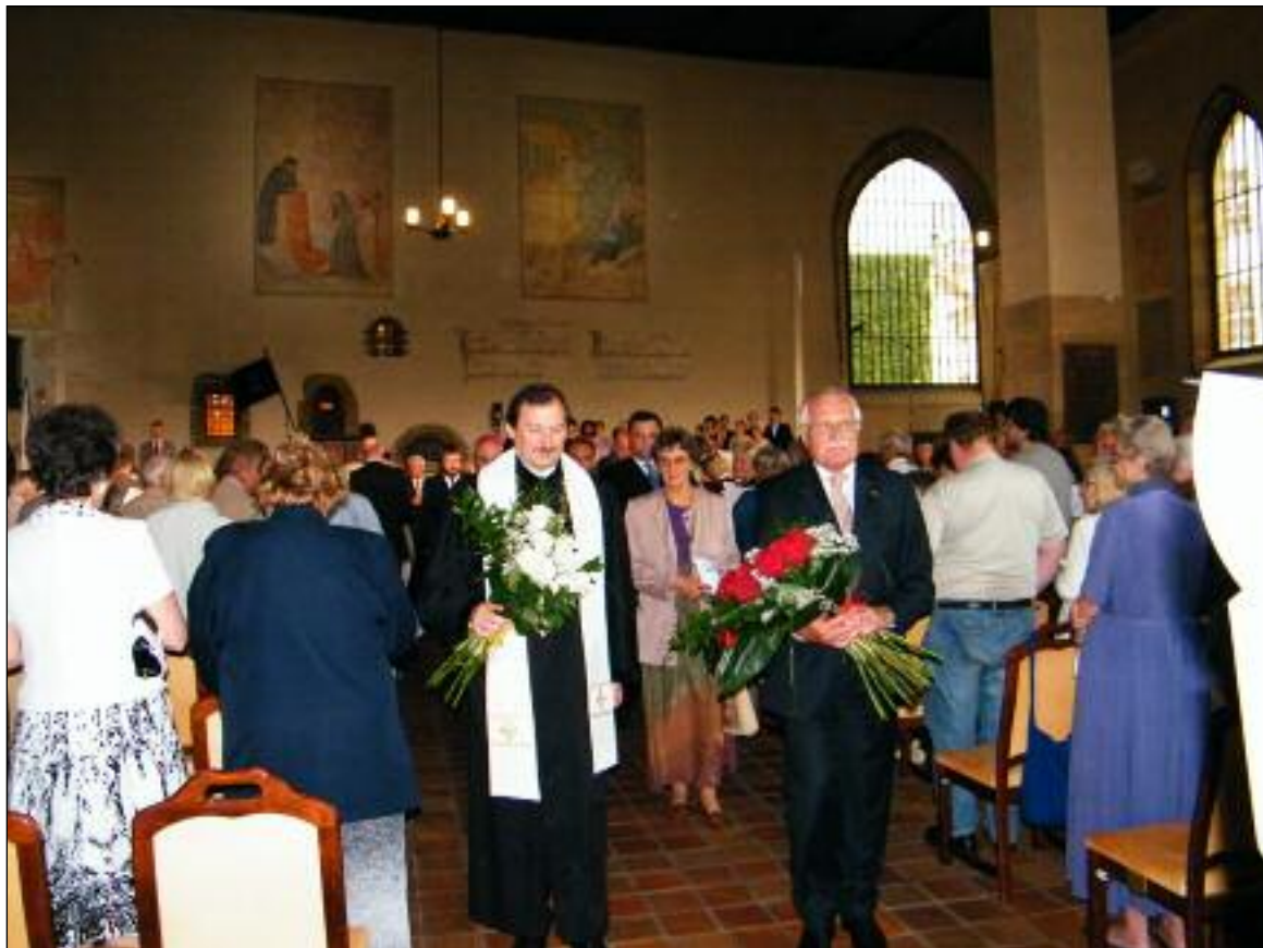
Bohoslužby v Betlémské kapli se letos zúčastnil i pan prezident Václav Klaus