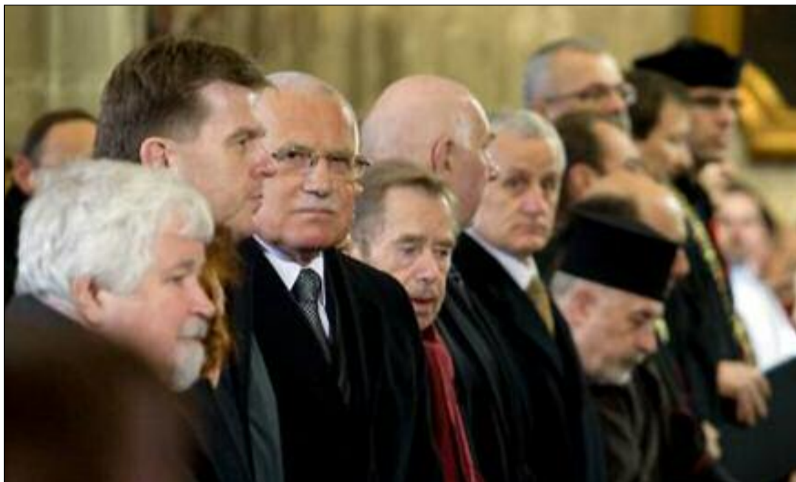
Intronizace nového pražského arcibiskupa Dominika Duky se zúčastnili nejvyšší státní činitelé

Dokladem ekumenické otevřenosti nového pražského arcibiskupa je však především jeho veřejný odkaz na 4. kapitolu listu Efezským, jež je jedním ze stěžejních biblických míst deklarujících křesťanskou jednotu („Jedno tělo a jeden Duch, k jedné naději jste byli povoláni; jedna víra, jeden křest, jeden Bůh a Otec všech, který je nade všemi, skrze všechny působí a je ve všech.“ Ef 4,4-6) spojenou s výzvou k vzájemné lásce („Snášejte se navzájem v lásce a usilovně hleďte zachovat jednotu Ducha, spojení svazkem pokoje.“ Ef 4,2b-3) a službě – každého podle milosti, která mu byla dána - která slouží k budování Kristova těla (Ef 4,7;11- 12) a „jsouce