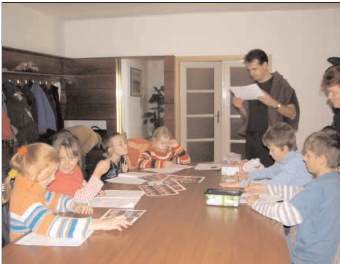
Výuka náboženství v Lysicích na Blanensku