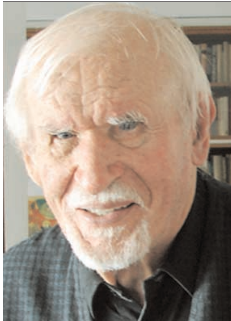
Slovenský básník Milan Rúfus