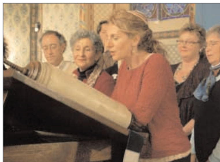
Simchat Torah v Heřmanově Městci