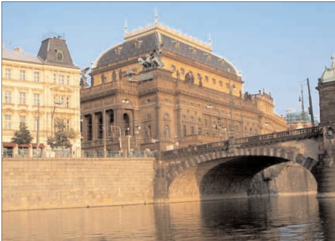
Národní divadlo v Praze letos oslavilo dvě jubilea - 145 let od otevření a 25 let od generální rekonstrukce

Ústřední rada projednala i zápis ze zasedání tiskové a publikační rady a souhlasí se záměrem sestry biskupky pozvat v jarních měsících 2009 do Olomouce příspěvatele Českého zá-