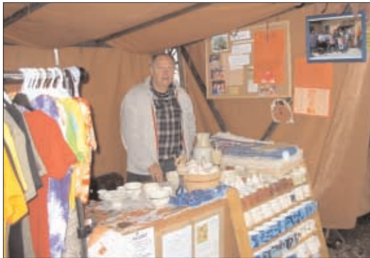
Stánek našeho diakonického zařízení Domeček Trhové Sviny