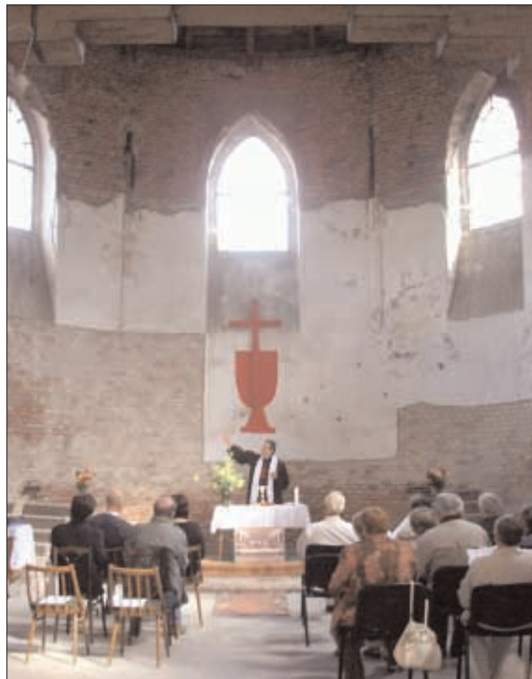
Bohoslužby v Liptovské Osade