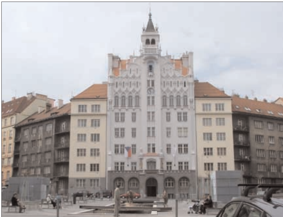
V neděli 27. dubna se konečně dostali na náměstíčko před úřadem ústřední rady definitivní bronzové koně