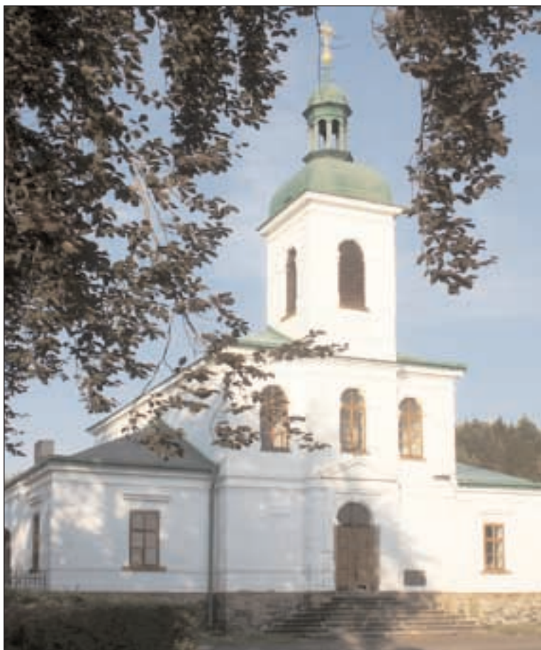
Nový kostel v Novém Boru