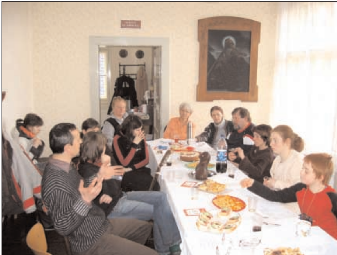
Z vikariátního setkání dětí a mládeže v Havlíčkově Brodě na Zelený čtvrtek

Chceme, abyste věděli, že náš Milíčův sbor je velkým objektem i se zahradou, na hlavním tahu městem a je v chráněné památkové oblasti. Zámek a zahrady – Květná a Podzámecká jsou zapsány v listině světového dědictví UNESCO. Tato okolnost také klade velkou starost o vzhled a údržbu celého objektu. Budova je stará 150 let a do všech oprav