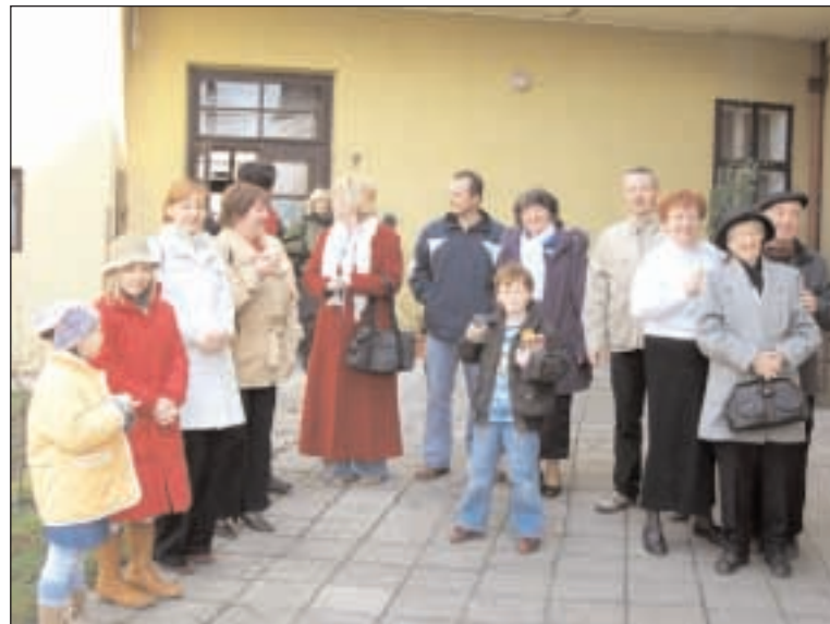
Někteří účastníci shromáždění náboženské obce Kroměříž - viz str. 1

Frýdl, David: Debata o činnosti bratří Mašínů se dotýká i církve. ČZ 88/13, 2008