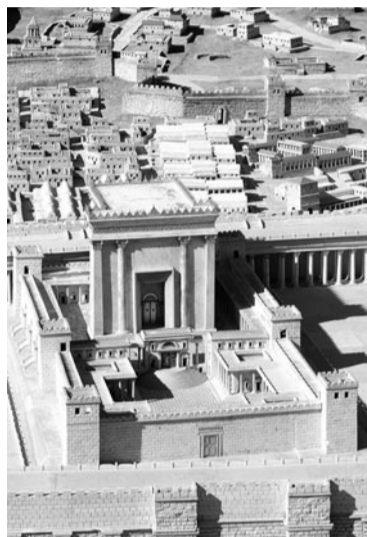
Model Herodova chrámu

Celkom inú správu o kráľovskej dobe a o Šalamúnovi nachádzame v knihách Kroník, ktoré opisujú históriu Izraela až do návratu z exilu. Boli dokončené až v po-