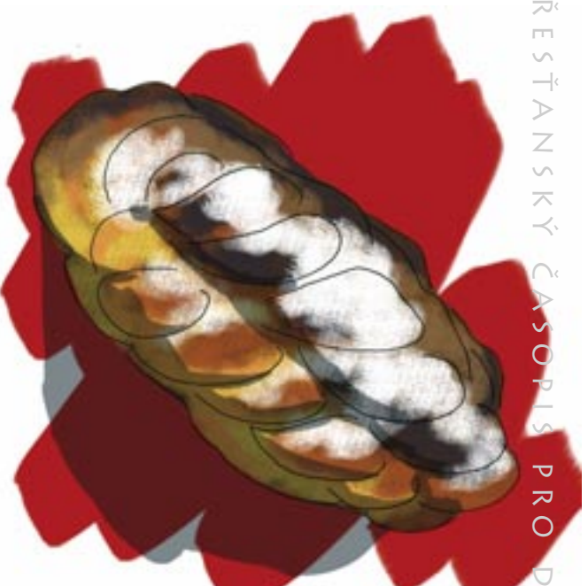
Nakreslila: Lucie Krajčířiková

„My ho přece nejlíme doopravdy“, zasmála se maminka, i když právě s velkým úsilím hněla všechny přísady do hladkého těsta. „Ostatně při bohoslužbě v kostele, když si při večeři Páně připomínáme jeho obět na kříži, taky jíme chléb a pijeme víno jako symbol jeho těla a prolité krve“, dodala vážně. Konečně bylo těsto hotové a maminka díži postavila kousek od