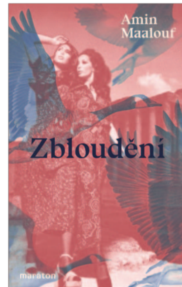
Amin Maalouf: Zbloudění .