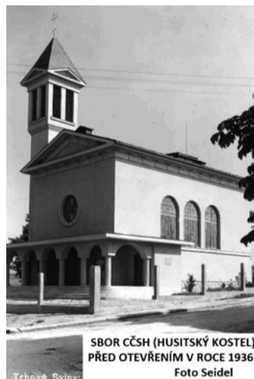
SBOR CČSH (HUSITSKÝ KOSTEL) PŘED OTEVŘENÍM V ROCE 1936

Nejvýstižněji celou úvahu popsal náš první prezident Tomáš Garrigue Masaryk: „Zbožnost korunuje a posvěcuje lásku. Náboženství bez lidskosti nemůže být správné; lidskost bez zbožnosti nemůže být úplná.“