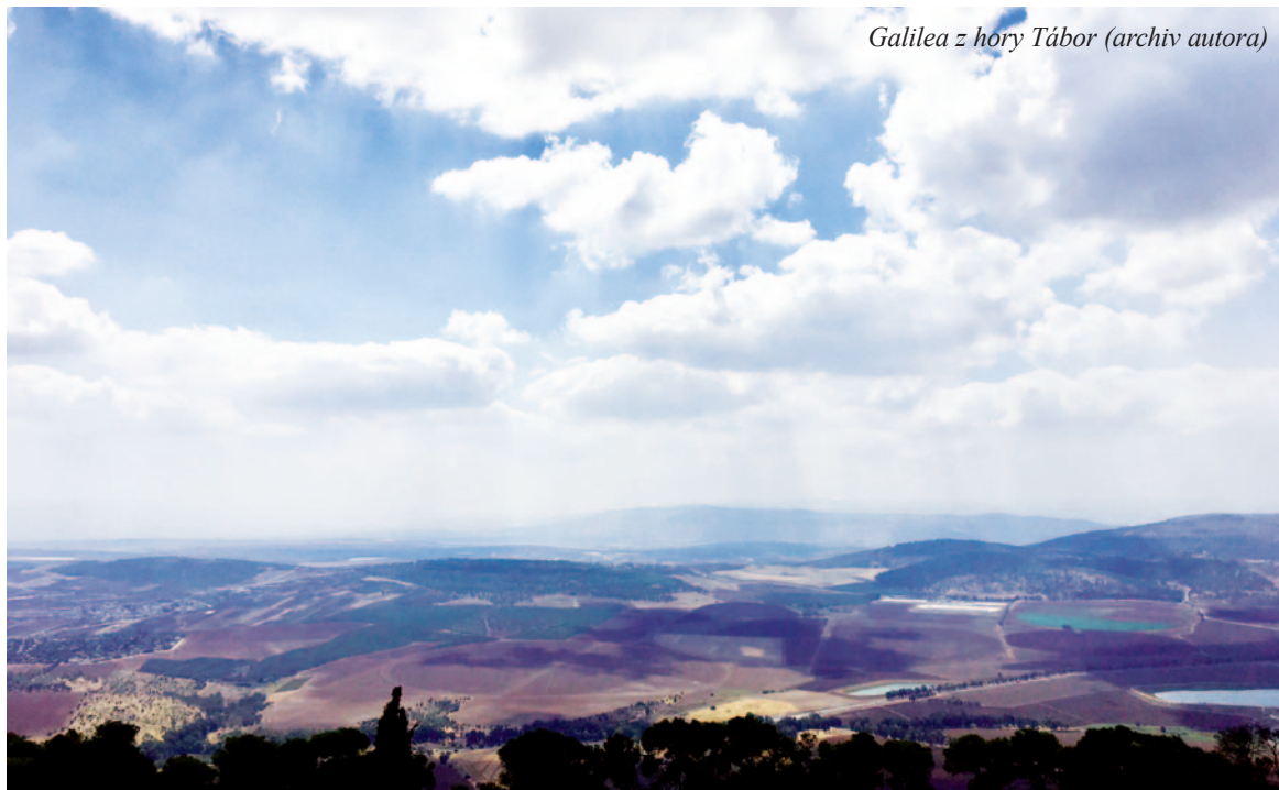
Galilea z hory Tábor

Třeba stejně jako se mění klima – a to, co nebylo dříve zjevné, se stává viditelnější – tak se mohou dostávat do popředí i otázky po víře, smyslu a řádu, a tím i po místě církve ve světě. Erika Oubrechtová