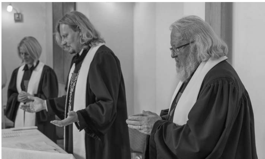
Při slavnostních bohoslužbách k 70+1 letům od vzniku náboženské obce v Novém Boru, 2021.

Dovol, Jano, abych to upřesnil. Nebylo to před několika lety, ale už hodně dávno, přesně v roce 2002. Tedy téměř před 20 lety. V týmu jsem od počátku jeho založení – v souvislosti s reorganizací Policie ČR po roce 1989. Po vzoru policie v Německu (Sasko), kde v každém týmu má své nezastupitelné místo i duchovní, se začaly zakládat posttraumatické týmy při krajských ředitelstvích Policie i u nás.