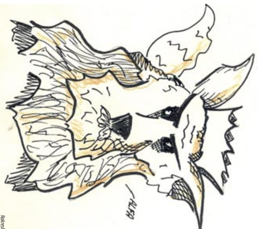
Nakreslila: Lucie Krajčířiková

V jedné velké vlčí smečce vládl vlk Alfa pevnou tlapou. Kdyžkoli dospěl další samec, musel se mu postavit v boji a když jej Alfa přebral, buď se mu dobrovolně podvolil, nebo musel smečku opustit. Až jednou někdo Alfou přemůže, zaujme jeho místo. Tak to v této smečce funguje odnepaměti. Samci společně loví, ale také se jako první nažerou. Když je potravy málo, ti slabší, včetně matek a mláďat, mají smůlu. Tak si ti nejsilnější účinně udržují svou moc. Mladý Rolf už také dospěl a blížil se den jeho souboje s Alfou. Rolf však prohlásil, že s Alfou bojovat nebude. „Mně se tohle uspořádání vůbec nelíbí!“ prohlásil. „Proč by se měli mít dobře jen ti nejsilnější? Vždyť kdyby Alfa netral na tom, že se mu všichni podřídí, nemuselo by ze smečky odcházet tolik vlků. Bylo by víc lovců i potravy a na každého by se dostalo.“ Když se to dozvěděl Alfa, jen se pohrdavě zasmál: „Z Rolfa mluví obyčejný strach!“