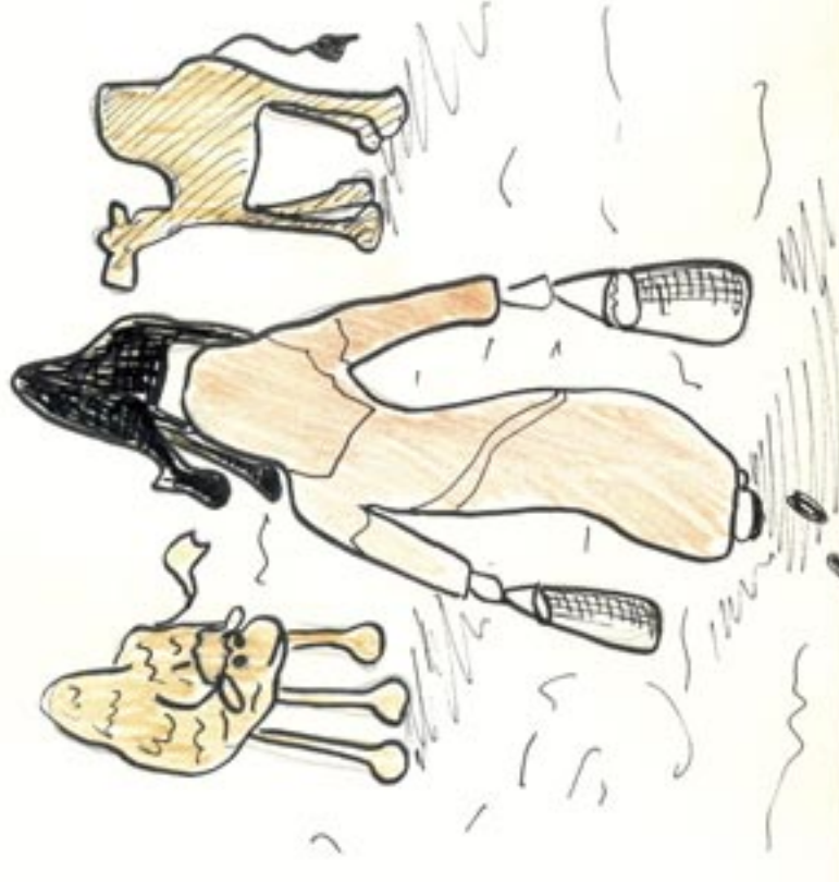
Nakreslila: Lucie Krajčířiková