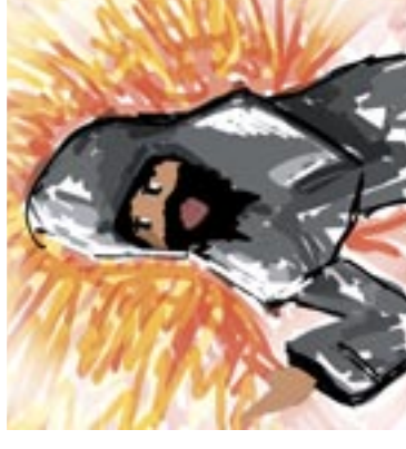
Nakreslila: Lude Krajiříková

Deset dní poté však došlo k událostem, popsaným ve druhé kapitole knihy Skutky apoštolů, jež si právě připomínáme o Svatodušních svátcích. Učedníci, zavření v domě, kde bydleli, najednou uslyšeli velký hukot jako od prudkého víchru a nad jejich hlavami se objevily jakoby ohnivě jazyky. Rázem došlo k jejich proměně - přestali se bát, vyšli ven a radostně všem vyprávěli o Ježíšovi a jeho