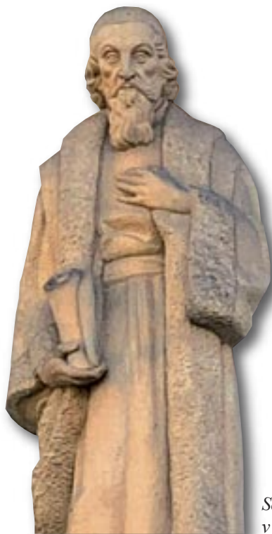
Socha Komenského na budově úřadu ústřední rady v Praze-Dejvicích