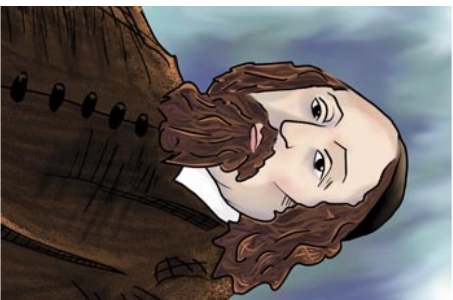
Nakreslila: Lucie Kvačičková

Od raného mládí život Komenského přichystal mnohá utpení a zkoušky – od úmrtí rodičů, manžalky a dětí, přes pronásledování, vyhnanství, ztrátu majetku i jeho díla. Jen pevná víra v Ježíše Krista mu vždy umožnila znovu se vzechopit a žít dál. Tuto svou zkušenost vtělil do tzv. útěšných spisů, v nichž mohou nalézat posilu i jeho čtenáři. Nej-