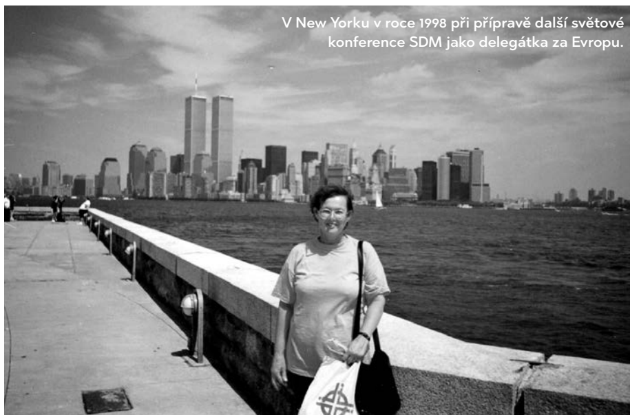
V New Yorku v roce 1998 při přípravě další světové konference SDM jako delegátka za Evropu.

Tatínek se ve volném čase věnoval práci pro církve a v rodině spíš duchovně působila maminka. K hnutí Světového dne modliteb (SDM) jsem se dostala v roce 1981, kdy jsem se stala farářkou v Náchodě a evangelický farář mi předal práci tohoto hnutí s tím, že je to ženská ekumenická aktivita a já jsem přece žena. V té době šla moje maminka (tehdy v 53 letech! – měla tři děti) do důchodu a do Náchoda mi dojížděla pomáhat s našimi třemi dcerami. Tatínek už byl také v penzi a převzal v Náchodě práci v kanceláři a správu kolumbária. Můj manžel mne