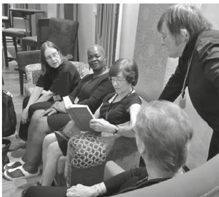
Z konference výboru žen z Anglie, Walesu a Severního Irsku při přípravě letošního SDM.

Chceme sebe a všechny lidi, za které se modlíme, svěřit Božímu milosrdenství a Boží ochraně ve jménu našeho Spasitele Ježíše Krista. Amen Více informací na www.csshk.cz .