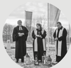
Na obálce: Setkání tří církví v Trojzemí, foto: Jaroslav Motl.