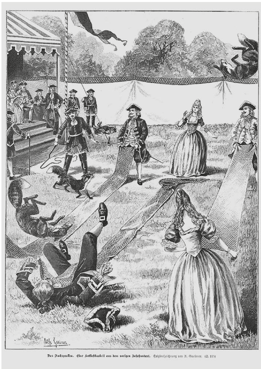
Das Zuschauen. Eine Hofballkugel aus dem vorigen Jahrhundert. Originalzeichnung von W. G. Pinxton. (2. 115)

Primatta základem, na němž by se mohlo zakládat lidské právo tyranie nebo útlaku vůči zvířatům. Právo nakládat se zvířaty podle lidského účelu, tedy aby zvířata sloužila pouze k uspokojení lidských cílů, popřípadě jako objekt uspokojení a vybití lidské agresivity, je v Primattově uvažování popřeno stejnou mírou citlivosti zvířat a lidí. Ve stvoření rozeznává prvky hierarchie, kde člověk je zvířeti nadřazen svojí dokonalostí a silou mysli. Ačkoliv je však pro Primatta příroda pojatá hierarchicky, nadřazenost v této