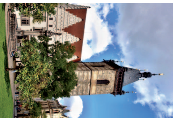
Novoměstská radnice v Praze