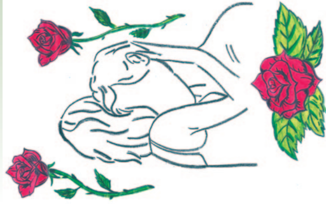
Illustrace Miriám Chytilová

Toužím po splnutí dvou těl, zatím čistých.