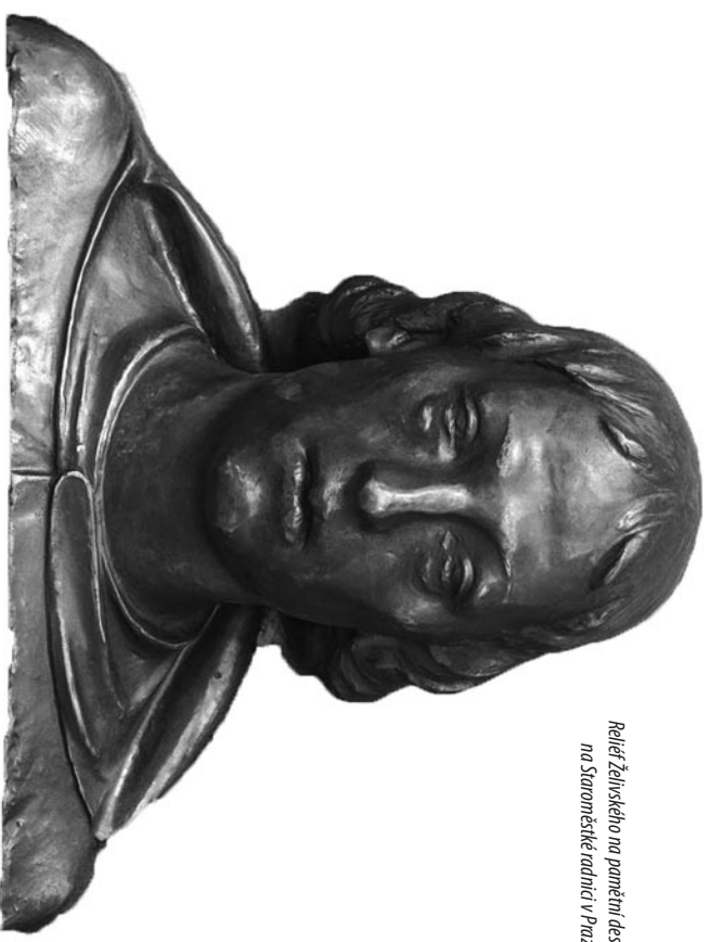
Reliéf Želivského na pamětní desce na Staroměstské radnici v Praze.

Nakonec byl Jakoubkem ze Stříbra obžalován a předvolán na Staroměstskou radnici. Zde byl zajat, odsouzen a 9. března 1422, tedy právě před šesti sty lety, popraven. Tuto událost připomíná pamětní deska, umístěná na Staroměstské radnici. Jan Želivský je představitelem nejradikálnějšího křídla husitského hnutí. V bouřlivých a revolučních