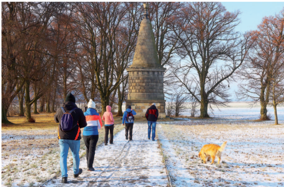
Žižkova mohyla v obci Žižkovo Pole v okrese Havlíčkův Brod je i v zimě cílem turistických výletů.