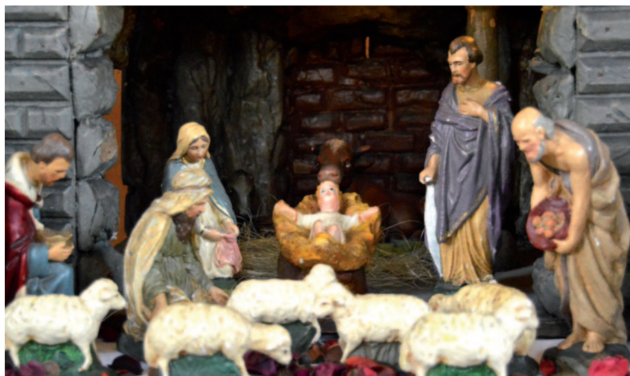
Betlém darovaný pražskému sboru naší církve na Smíchově r. 1936, který zde můžete vidět na právě probíhající výstavě.

služebníci a poslové. Svět víry má svá tajemství a tento skrytý duchovní svět představují andělé. Tento pro nás skrytý neviditelný duchovní svět ví o Ježíšovi, neboť on z tohoto Božího světa přichází jako věčný Syn věčného Otce. Andělé zpívají k jeho počtě, chválí ho a uctívají ho. Jeho jméno je uctíváno v nebi a má být ve cti i u lidí na zemi (Fp 2,9-10). Vznešenost Ježíšova je dána tím, že on zrcadlí Boží slávu. Je její „odlesk“ a „výraz“ Boží podstaty (Žd 1,3). „Spatřili jsme jeho slávu, jakou má od Otce jednorozený Syn plný milosti a pravdy“ (J 1,14). Tato Boží sláva přichází s Ježíšem o Vánocích do tohoto našeho světa.