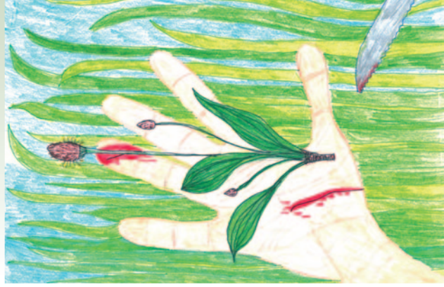
Ilustrace Miriam Chytilová

Správné řešení ze str. 1: 1 E, 2 J, 3 G, 4 A, 5 C, 6 H, 7 D, 8 K, 9 B, 10 I, 11 L, 12 F.