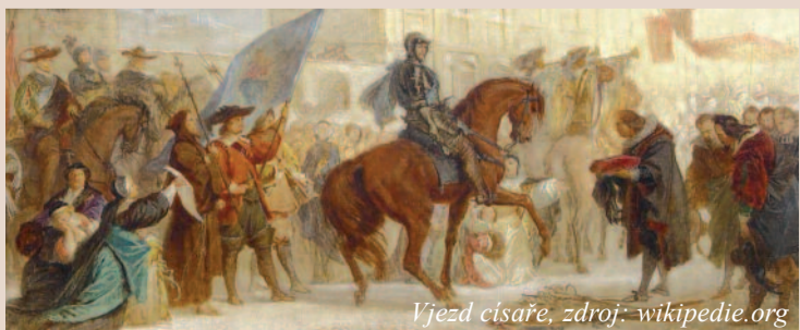
Vjezd císaře