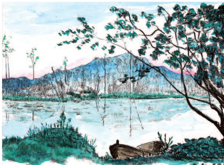
Kresba Miroslava Matouše