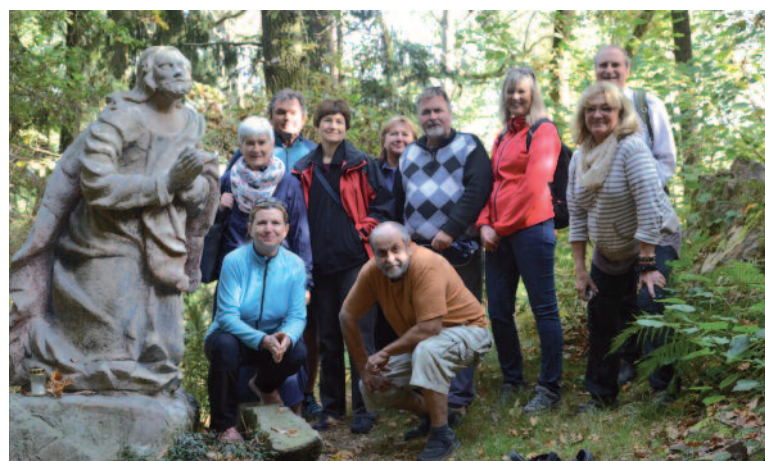
Na snímku Josefa Švehly jsou účastníci setkání u sochy Krista modlíciho se v Getsemanské zahradě.