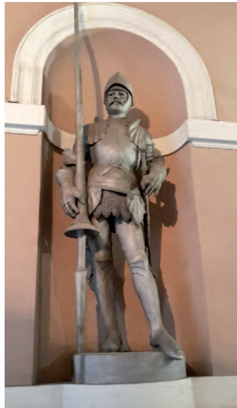
4. byt Masarykových - socha rytíře v průjezdu domu