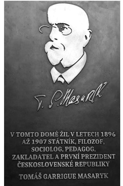
V TOMTO DOMĚ ŽIL V LETECH 1896 AŽ 1907 STÁTNÍK, FILOZOF, SOCIOLOG, PEDAGOG, ZAKLADATEL A PRVNÍ PREZIDENT ČESKOSLOVENSKÉ REPUBLIKY TOMÁŠ GARRIGUE MASARYK

Šestý byt obývaný Masarykovou rodinou v letech 1894 až 1896 byl situován v zadní části Hrzánského paláce na Hradčanech s přístupem z Loretánské ulice. Pro kulturní oblast byl od r. 1893 vydáván nový časopis nazvaný „Naše doba - Revue pro vědu, umění