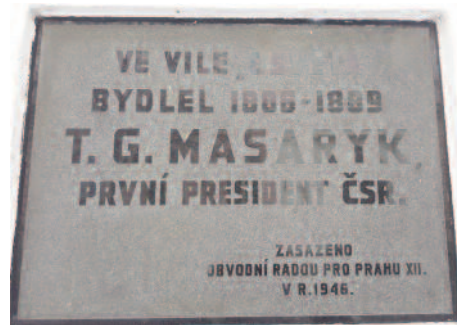
Deska k připomínce TGM - ulice Jana Masaryka č. 22.