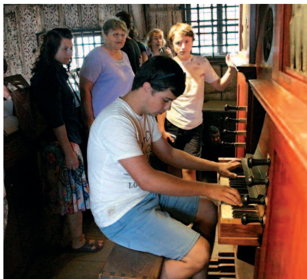
Varhany v kostelíku Panny Marie