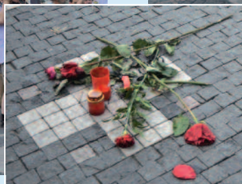
Církev československá husitská si připomněla výročí 400. let od poprav 27. českých pánů na Staroměstském náměstí.