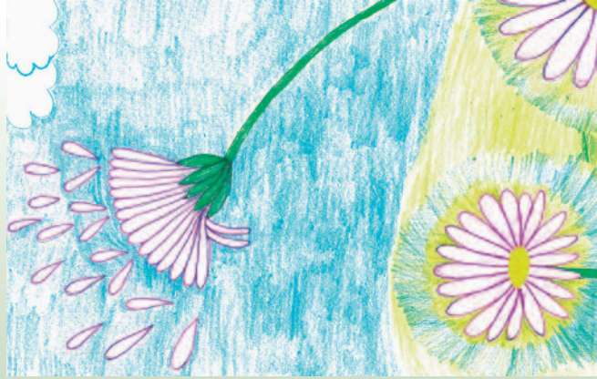
Ilustrace Miriam Chytilová

jako by neustále dobíhal ujíždějící vlak. Jak je to vlastně dlouho, co na poslední maminku navštívil? Loni na Vánoce?