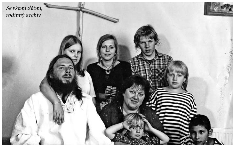
Se všemi dětmi

Když píšu scénář, většinou už vidím, v jaké asi kulise se bude příběh odehrávat. Mám rád staré, už nefunkční věci, které dostanou novou „roli“. Začnou opět, i když jinak, sloužit. Rád na kulise pracuji a vymýšlím, co všechno by se v ní a s ní mohlo dělat. Některé technické věci však přenechávám kamarádům odborníkům, kteří své řemeslo opravdu ovládají. Scéna je vždy vyrobena tak, aby se dala rozložit a naložit do auta. Vypadá to zajímavě, když ji pak sestavuji na jevišti, ale ne vždy mohu říct, že je to to, co mě u toho