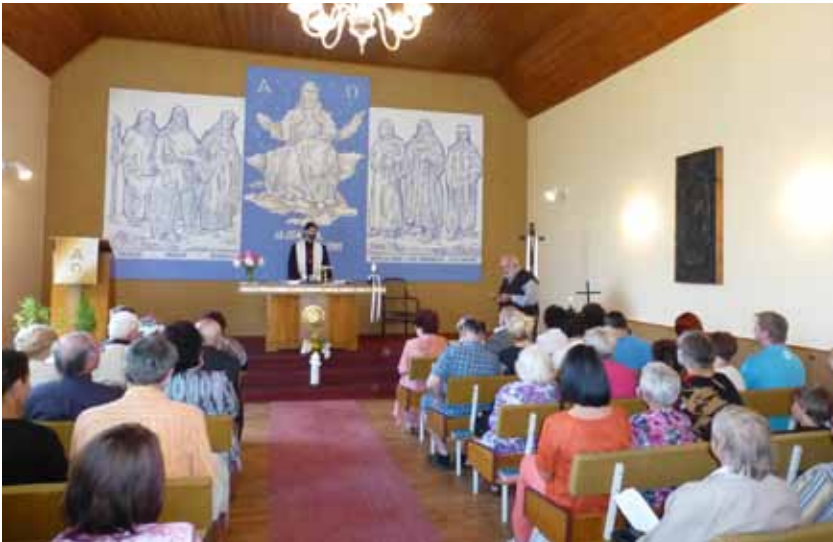
Z oslavy 60-tého výročí sboru Cyrila a Metoděje v Pěňčíně.