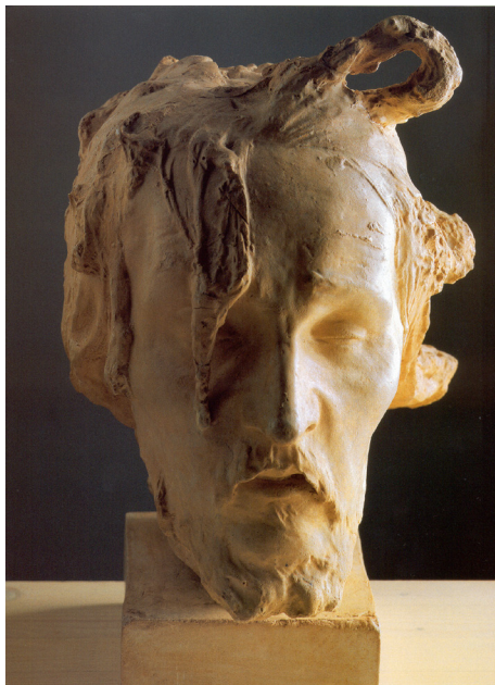
Hlava ukřižovaného Krista (1896)