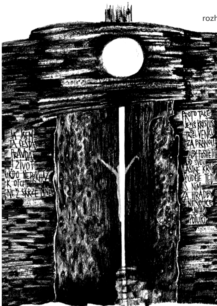
Ilustrace z cyklu Brány, Úzká brána: Židům 13,12mn

Četla jsem před lety strhující knihu Roberta Littela, která mi velice živě přiblížila no-