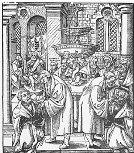
Mistr Jan Hus a Martin Luther v dřevorytu Lucase Cranacha (1472–1553) o sto let později.

mem je odloučení Husa od následujícího husitského hnutí, které Husa poposunuje do pozice pouhého oponenta, nikoliv reformátora. Husovo učení totiž hluboce zpochybnilo legitimnost v církvi navykých forem uvažování a myšlenky, že reálná dobová podoba křesťanství je uskutečněním evangelia.