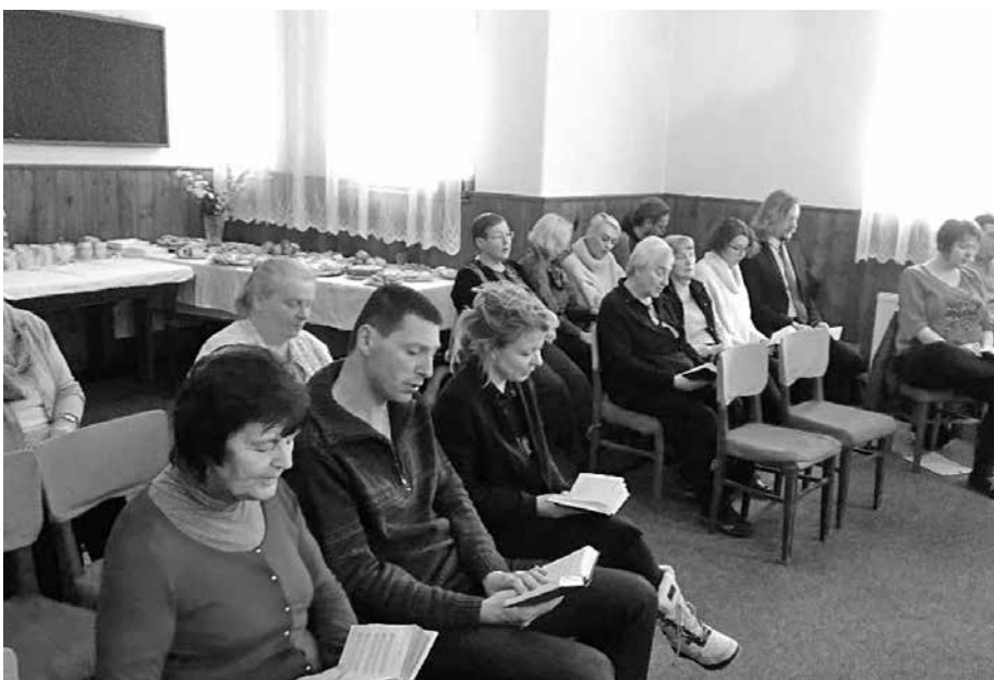
Vikariátní shromáždění náhodského vikariátu, Náchod.