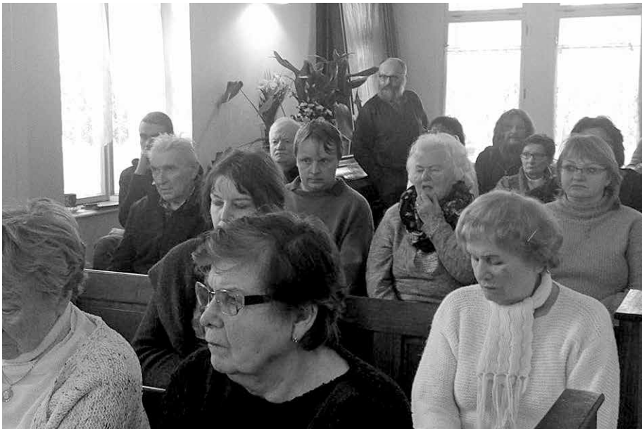
Vikariátní shromáždění libereckého vikariátu, Jablonec nad Nisou.