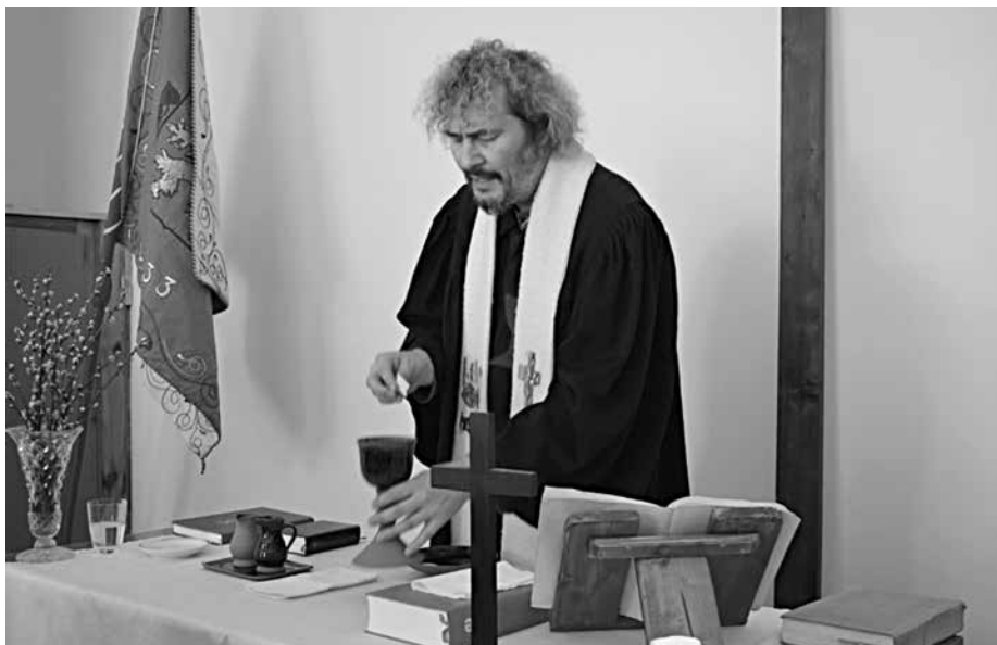
Bohoslužby v modlitebně v Přelouči.

Máme církve, kde je běžné, že se oddávají homosexuálové a lesby. V křesťanských církvích jsou i lesbicky orientované biskupky. Je to ultra liberální model. Máme i komunity, které jsou velmi uzavřené, konzervativní, nebojím se říci s fašizoidními rysy. Slouží se tam latinsky. Ani jedna z těch komunit lidi nijak masově nepřitahuje, čili není to v modelu organizace. Je to jakýsi světový spiritus agens naší doby, který nepřeje organizovanému křesťanství. Navíc, každý má svůj jazyk. Někdo alternativní, třeba jazyk nezávislé hudební produkce. A má jej i církev. Jestliže se někdo domnívá, že církev oživí tím, že bude nosit lebku významného muže, svatého Václava, že bude chodit v oblecích, které vypadají, jako že jde zrovna dělat Mikuláše, jestliže si někdo myslí, že síla je v tom, že na Mistra Jana Husa se ukáže šest našich biskupů v temně černých talárech s rudým kalichem, s řetězem na krku a s biretem na hlavě v televizi, že to přitáhne lidi, nepřitáhne. Je to jazyk, kterému oni nerozumí. Budoucnost je podle mne v komunitním způsobu setkávání.