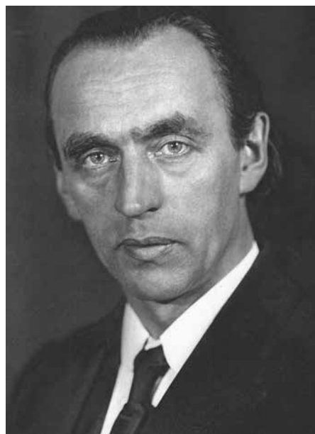
ThDr. Karel Farský

Život národů dlužno měřit po staletích a tisíciletích. Přehlédající historii jejich, poznáváme v ní i jara nadšeného, čistého, kulturního rozkvětu, i úrodná léta hýřící úrodou a blahobytem, i drsné, chladné jeseně divých úpadků a skučivých bouří listopadových, i temné zimy trva-