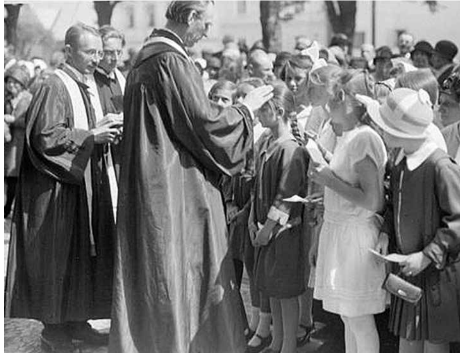
První patriarcha při biřmování.

Doufejme, že výklad jen možný, ne nutný a nevyhnutelný. Ale pro výstrahu, abychom neopomíjeli „ujmouti se zase práva svého, když nám milosrdenství