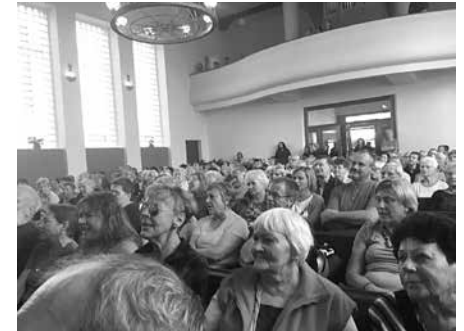
Při koncertu Spirituál kvintetu

Najednou tu bylo odpoledne a do opět zcela zaplněného Sboru Páně nastoupila muzikantská