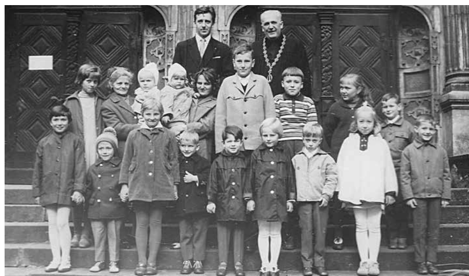
Broumovská duchovní péče o děti, při návštěvě bratra biskupa Pochopa byly mnohé z nich teprve pokřtěny.