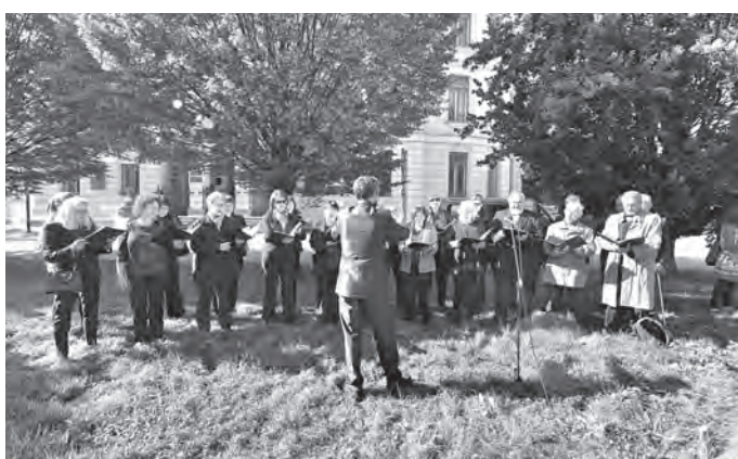
Smíšený pěvecký sbor Smetana Hradec Králové.