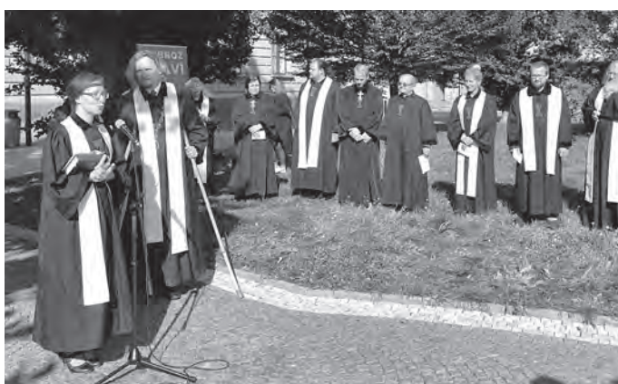
Při zahájení diecézního dne.