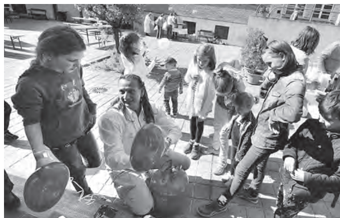
Děti dostávaly po biblické výchově balonek na cestu.