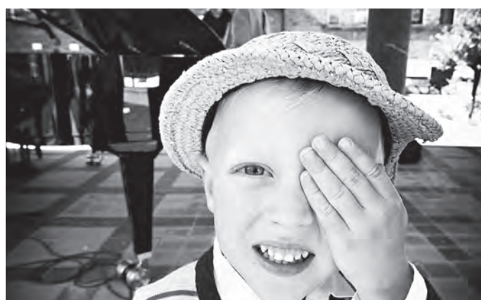
Fota diecézního dne: © Patrick Marek