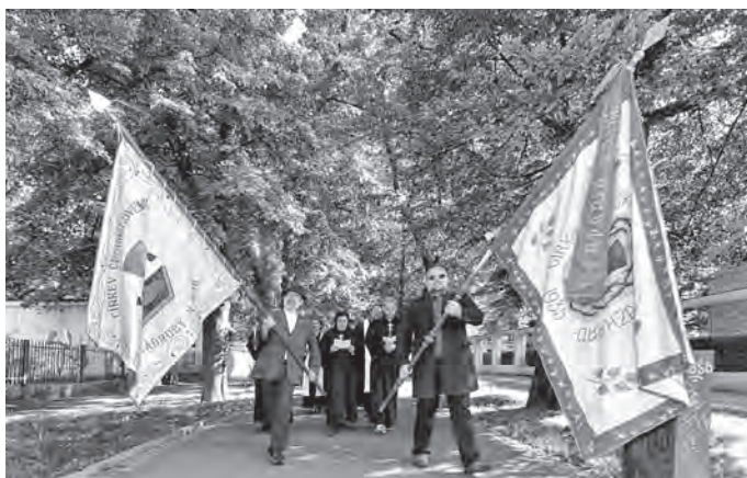
Pouť z náměstí Svobody ke Sboru kněze Ambrože.