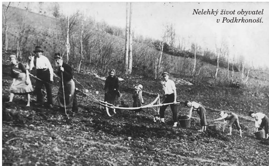
Nelehký život obyvatel v Podkrkonoší.

Před více než třiceti lety jsem působil jako farář v rodném kraji Farského v Semilech a administroval jsem Vysoké nad Jizerou. V té době žili ještě někteří z pamětníků, kteří si osobně pamatovali setkání s dr. Karlem Farským ze svého dětství. Jeden již velmi letitý bratr mi vyprávěl, jak dr. Karel Farský sloužil mši venku u kříže v Tríči. Tríč je vesnice u Vysokého nad Jizerou smě-