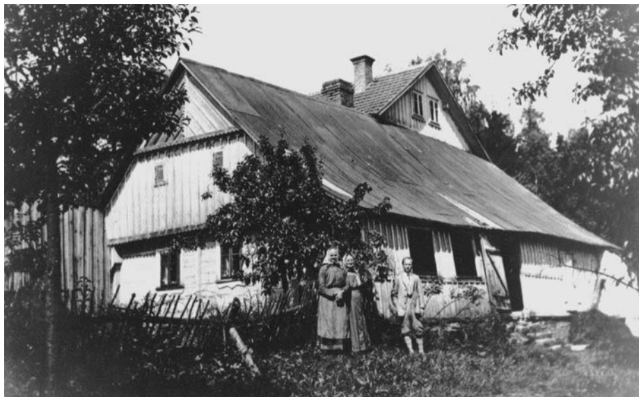
Rodný domek Karla Farského ve Škodějově.