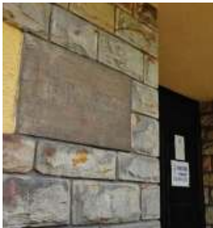
Mramorový základní kámen darovala pražská firma PRASTAV a.s.