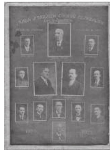
Tablo I. rady starších

monogramem výstavby a přehledem jmen významných dodavatelů materiálu a prací pro stavbu. Jména mnohých jsou v našem městě stále živá. Starosta města Čelákovíc ve svém projevu ocenil práci sestry farářky v ekumenické oblasti a přínos Husova sboru pro kulturní a společenský život města. Starosta