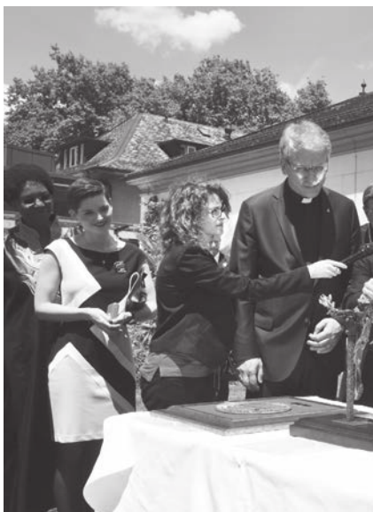
Papež František přináší dary a také přijímá ikonu s obrazem Ježíše Krista jako vinného kmene

Výhled směrem k jednotě: Papež František po příletu do Ženevy řekl, že „ Je to cesta směrem k jednotě, doprovázená touhou po jednotě... “, cesta, pouť – chcete-li, je symbolem pohybu vpřed, a to společně, k cíli, který je pro všechny křesťany stejný. Během společné bohoslužby v kapli ekumenického centra jsem měla možnost přečíst text z listu apoštola Pavla Galatským (3,28) „ Není už rozdíl mezi židem a pohanem, otrokem a svobodným, mužem a ženou. Vy všichni jste jedno v Kristu Ježíši. “ a to je myšlenka, které se papež František ve svém kázání dotýkal, vysvětloval ji a ukázal i směr, kudy by se křesťané měli ubírat. František má schopnost