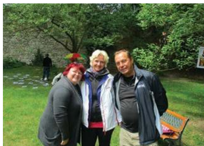
Dobrovolníci na přípravě Pouti