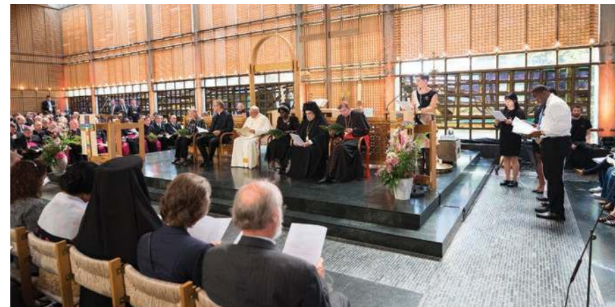
Ekumenická bohoslužba slova v kapli Ekumenického centra v Ženevě

První kroky dlouhé cesty: Psal se rok 1948, když 23. srpna v Amsterdamu vznikla na svém prvním zasedání Světová rada církví, která navázala na úspěchy dosavadní práce Hnutí víra a řád. Toto hnutí poprvé zasedalo roku 1927 v Lausanne, kde se rozhodlo o ustavení pokračovacího výboru, který se (mimo období 2. světové války) setkával každý rok až do založení Světové rady církví. Ta přeměnila hnutí ve Výbor pro víru a řád při SRC.