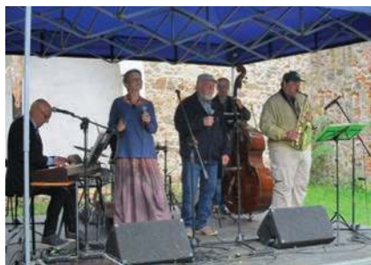
Hraje a zpívá Swingkopacentra