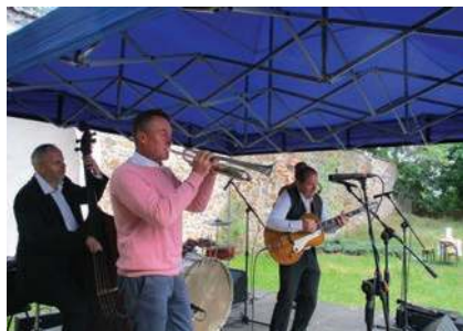
Vystoupení Melody Boys