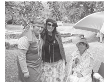
Dobrovolnice při realizaci Pouti