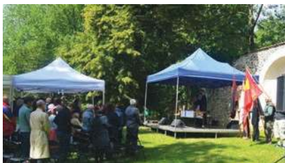
Bohoslužba v Severní zahradě

se rádi. Aby nám zůstala příroda čistá. Aby nebyla válka.“ A s největším ohlasem u přítomných rodičů se setkalo poslední dětské přání: „Aby už byly prázdniny.“