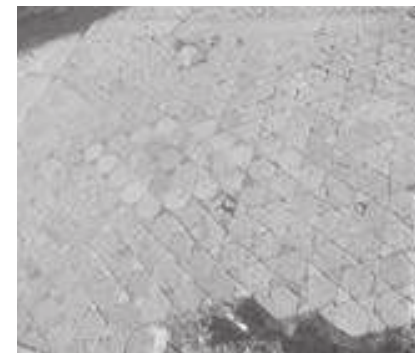
Vykopávky v Salamis

jen vynikající vojevůdce, ale zasloužil se i o reformu řečtiny, kdy se slova ve větě psala odděleně). Turci této významné archeologické památce nevěnují příliš velkou památkovou ochranu. Je velká škoda, že mnoho kamenů ze slavného Salamis bylo odvezeno do Famagusty, kde byly použity jako stavební materiál. Nedaleko od archeologického naleziště stojí klášter sv. Varnavasa (apoštol byl umučen v Salamis v roce 45). Světec doprovázel sv. Pavla na misijní cestě po Kypru. Ve městě Salamis se také narodil sv. Barnabáš, raně křesťanský konvertita, původním jménem Josef. Jméno Barnabáš získal poté, co prodal na Kypru veškerý majetek a utržené peníze věnoval církvi v Jeruzalémě. Když se sv. Pavel vrátil po svém obrácení do Jeruzaléma, byl to právě Barnabáš, který se sv. Pavla ujal a představil ho ostatním apoštolům. Působil v Antiochii společně se sv. Pavlem. Cesty těchto světců se