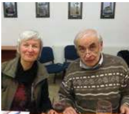
Divačka si koupila pět autorových knížek