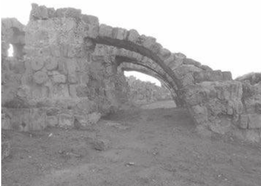
Vykopávky v Salamis

připluli ke břehu, ale vodu marně hledali. Zoufalému kapitánovi sv. Ondřej přikázal, aby loď ještě jednou připlula ke břehu, kde udeřil palicí o skálu, ze které vytrysknul pramen. Kapitán byl stížen oční chorobou, a tak mu světec poradil, aby si v té vodě omyl oči. Hned po umytí se jeho zrak zázračně uzdravil. Voda ze skály teče dodnes a lidé si ji berou do nádob domů pro léčbu nejrůznějších neduhů. Po ochutnání této vody mohu konstatovat, že je velmi dobrá a její měkkost je způsobena složením okolních hornin. Sv. Ondřej se narodil v Betsaidě (v dnešní Izraeli) na břehu Galilejského jezera. Protože byl žid, tak Ondřej nebylo jeho původní jméno. Byl učedníkem Jana Křtitele a později se přidal k Ježíši i se svým bratrem Šimonem (Petrem). Působil v Malé Asii a na území dnešního Ruska. Byl prvním biskupem Bizantie. Podle legendy byl ukřižován kolem roku 60 ve městě Patras (dnes třetí největší město v Řecku vzdálené 200 km od Athén) v Acháji na kříži ve tvaru X (svatoondřejský kříž).