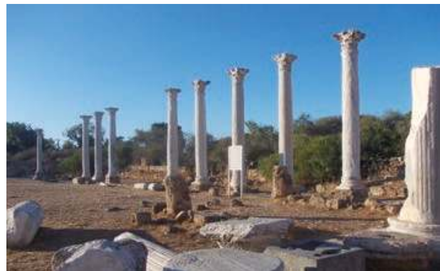
Vykopávky v Salamis

ka do písku a když se vylíhnou, dostávají se do moře za svitu měsíce. Dříve tu stával hotel a elektrické osvětlení je dezorientovalo. Některé želvy se proto nedostaly do moře a hynuly. Nejvýchodnější část poloostrova Karpaz je prohlášena za rezervaci a jsou tu k vidění stáda ovcí, spousta ptáků i divocí osli, kteří tady zbyli po vyhnaných kyperských Řecích v roce 1974. Cesty jsou dále už jenom šterkové, a tak několika drzým oslům nedá žádnou velkou práci cestu zastoupit a čekat, že dostanou něco dobrého, aby milostivě auto uhnuli. Na konci cesty, kde poloostrov končí, se náhle vynoří klášter a kostel sv. Ondřeje, který je otevřen od úsvitu do soumraku. Vstupné se do kostela neplatí, a tak je možné přispět finančním darem do pokladničky na stavební opravy. Kostel je vybudován vedle původní byzantské baziliky, která se časem promění v ruinu, protože Turci nemají zájem opravovat křesťanské kostely. Podle legendy se sv. Ondřej plavil po moři okolo a námořníkům došla voda. Několikrát