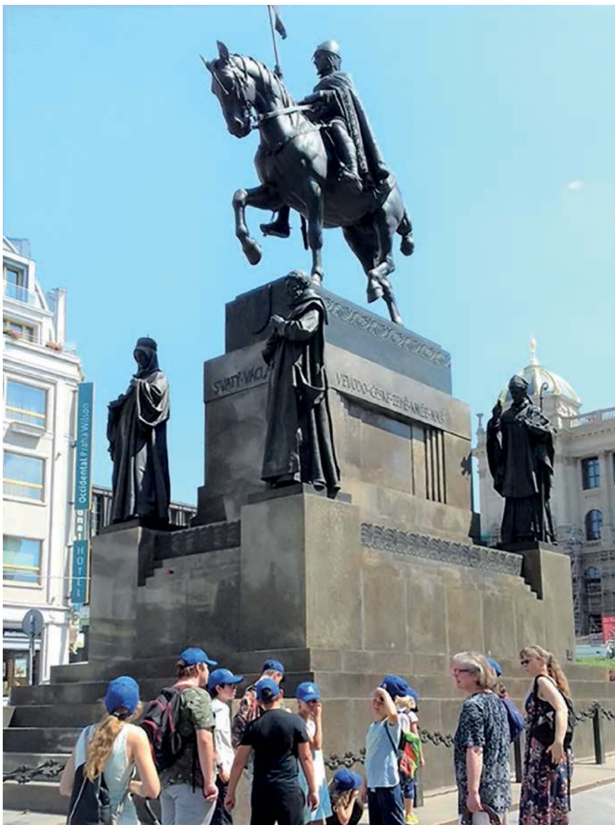
Opat Prokop je zpodobněn na podstavci sochy sv. Václava jako jeden z českých patronů (uprostřed). Jeho tvář je autoportrétem J. V. Myslbeka.