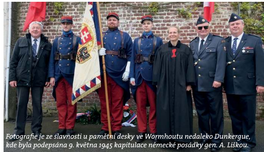
Fotografie je ze slavnosti u pamětní desky ve Wormhoutu nedaleko Dunkergue, kde byla podepsána 9. května 1945 kapitulace německé posádky gen. A. Liškou.

Dunkergue je strategické přístavní město, které je do současnosti námořní základnou se suchými doky. Pro ochranu tohoto přístavního města a oblast Flander byla po francouzsko – pruské válce na okraji zalesněných pískových dun vybudována pevnost Fort des Dunes. Pevnost i přístav kupodivu přežily 1. světovou válku a významně se zapsaly i do historie II. světové války.