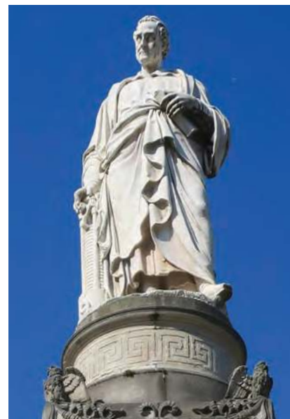
Pomník A. Volty

Jezero Como (Lago di Como) je třetím největším jezerem v Itálii, leží v nadmořské výšce 198 m, má rozlohu 146 km 2 a jeho hloubka je 410 m. Je to nejhlubší a zároveň jedno z nejkrásnějších jezer v Itálii. Vzniklá proláklina se v horském masivu zaplnila vodou z ledovce. Dno jezera je o více jak 300 m níže než je nadmořská výška, a proto jde o kryptodepresi (geomorfologický pojem). Ze všech jezer na světě má největší kryptodepresi jezero Bajkal (1185,5 m).