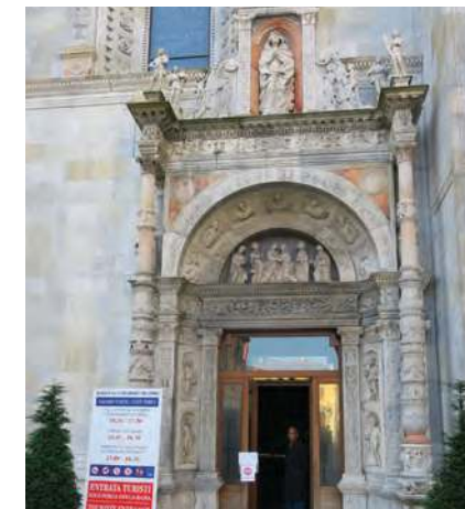
Vstup do katedrály v Como

Při pohledu z letadla jezero připomíná obrácené písmeno Y a právě tam, kde se rozdvouje, leží město Bellagio. Plavba lodí po jezeru stojí za to a je prostě úžasná. I přestože Itálie je na naše poměry drahá, vyplatí se do plavby investovat pár EURO. Asi nejvýhodnější je popojet autem z Como do Megiore a zaplatit si plavbu lodí do Bellagia, dále do Varenny a zpátky do Megiore.