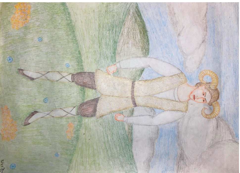
Znamení zvěrokruhu – kozoroh podle Vašíčka