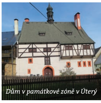
Dům v památkové zóně v Úterý

Pokud projíždíte západní Čechy a Tepelskou vrchovinu a máte štěstí, přijedete do malebného údolí Úterského potoka, kde se nalézá město Úterý, jedno z nejmenších v České republice (páté nejmenší). O co je toto město menší, tím je malebnější a zajímavější. I když má nízký počet obyvatel, (asi 420, a to včetně osad Olešovice a Vidín) na každém kroku na vás dýchá historie. Nejstarší známé archiválie o městě pocházejí z roku 1233. Tohoto roku král Václav osadu věnoval své matce Konstancii, a ta ho téhož roku prodala řádu premonstrátů. Původní osada tu snad stála již v 11. století a založili ji němečtí horníci, kteří sem přišli na základě pozvání Přemyslovců. Podle pověsti jeden z horníků zabloudil v lesích a zmožen únavou si lehl pod strom, kde usnul, a zdál se mu sen o nalezišti zlata. Když se ráno probudil, uviděl havrana, který v zobáku svíral zlatý prsten. Havran vyletěl do výšky a po nějaké době prsten upustil na zem. Právě na tom místě horník našel zlatou rudu. Město má ve svém znaku kráčejiho havrana s prstenem v zobáku na zlatém poli.