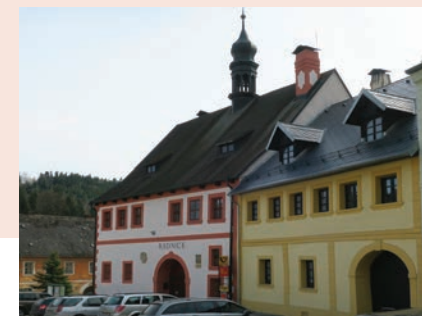
Raadnice v Úterý

Město bylo v průběhu staletí postiženo morem, záplavami, a také požáry i válkami. Obyvatelstvo tu strádalo především v průběhu 1. světové války, a to jak hladem, tak nedostatkem uhlí a odvodem mužů do války. V roce 1938 se Úterý nacházelo v Sudetech, bylo zabráno Německem a většina mužů musela narukovat do 2. světové války. Po roce 1945 byla převážná část německého obyvatelstva z pohraničí odsunuta do Německa a velký počet měst a vesnic v této oblasti se téměř vyhladil. Úterý bylo částečně dosídleno z vnitrozemí a reemigranty z Volyně na Ukrajině. Mnoho domů ve městě zachránili chalupáři v 60. letech 20. století.