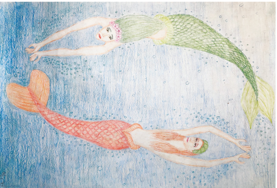
Znamení zvěrokruhu – ryby podle Vašíčka