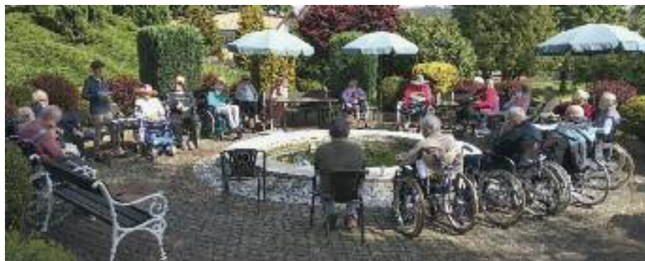
V Domově U Spasitele