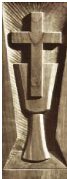
Symbol ČČS, F. Hromádka

vyznačující kritické pojmání tradice kříže a kalicha.