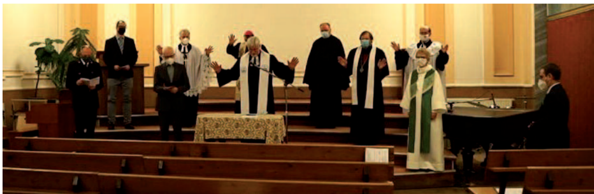
Společná ekumenická bohoslužba představitelů církví v rámci Týdne modliteb za jednotu křesťanů.